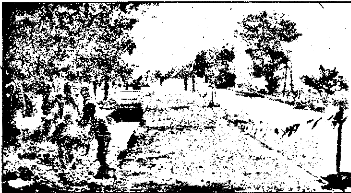
Intrarea spre Nădlac: se lucrează la lărgirea carosabilului cu circa 1,50 metri în stînga și dreapta actualii șosele.

Scut interviu cu dl. A. RABINOWITZ, expert în urbanism