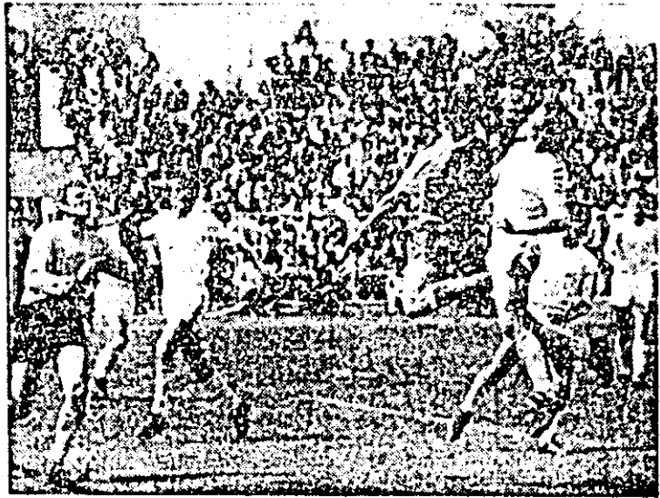
Fază din meciul UTA - Mureșul Deva.

gazdelor, cu care însă sîntem deja familiarizați. Am selectat din cele cece ce numim de obicei „marile ocazii”, vreo 7-8, ținînd de inabilitatea