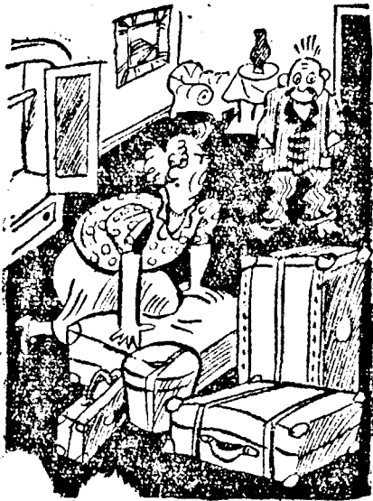
Magam a Borundó

ZÜRICH TÖZSDEZARLAT: Paris 11.79 és egynegyed, London 20.83 és háromnegyed, New-York 44.5 és fél, Brüsszel 73.32 és fél, Milánó 23.42 és fél, Amszterdam 237.90, Berlin 178.60, Szófia 540, Varsó 84, Belgrád 10, Bucuresti 2.25.