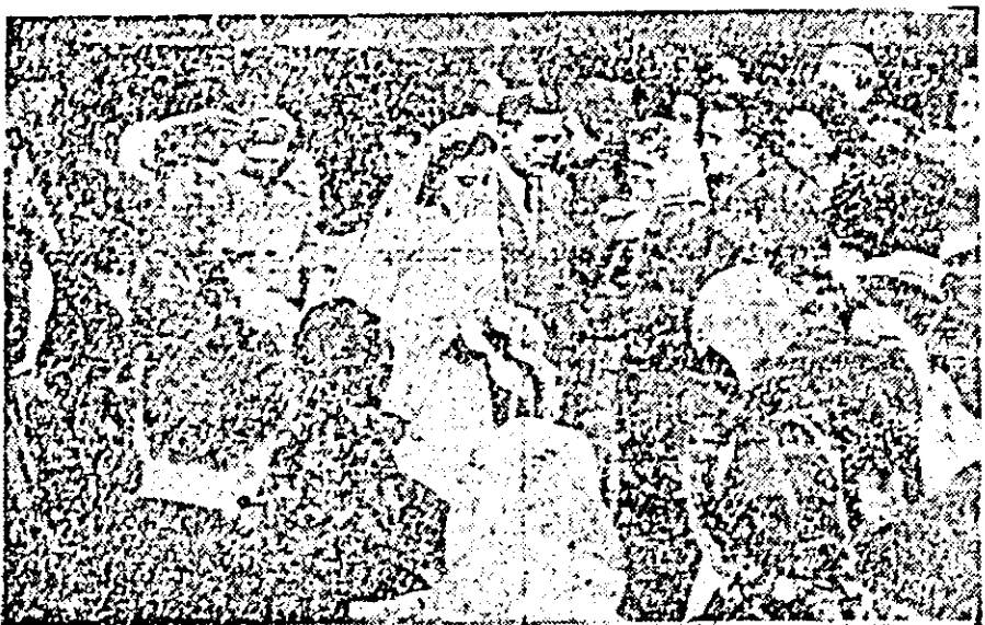
În fața oșterului stării civile. De acum tinerii au devenit soț și soție.