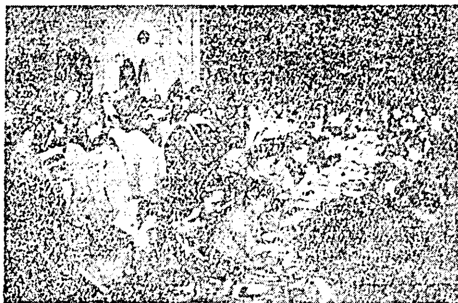
În timpul ospățului

direa unde începuse ospățul e acum liniște. Nu, e forfotă mare. Gospodinele pregătesc aici de-aie gurii. În zecă căldări ciocotesc mincarea; gănitile, tocana... Dar cine mai fine cont de toate bunătățile?