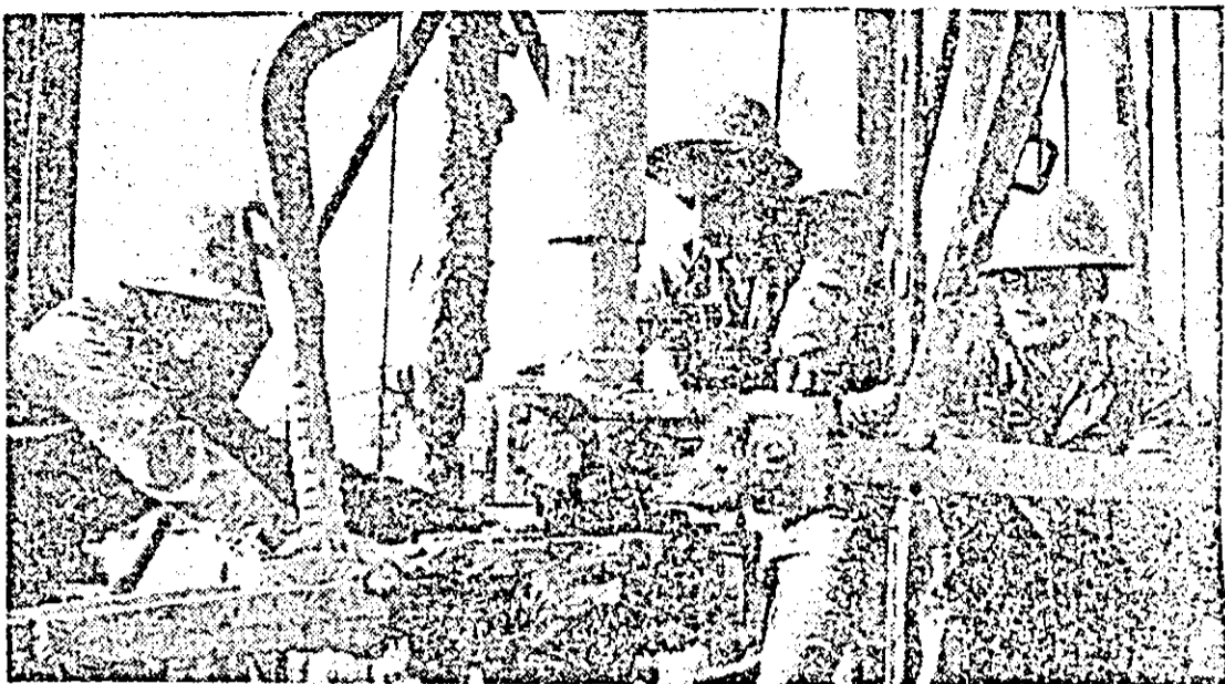
Tenare încleștare cu adîncurile Terrei pentru a aduce la lumină valorosul „aur negru”, deplină mobilizare a tuturor energilor creatoare, ordine și disciplină, deosebită lubre pentru meseria de petrolist — iată coordonatele delinților între care se încadrează activitatea sondorilor de la Schelele de foraj din Zădăreni, oameni ai muncii care nu precupețesc nici un efort pentru a obține, în clauza Congresului al XIII-lea al P.C.R., noi și remarcabile realizări în producție.

— La fel ca toți petroliștii din patria noastră, și oamenii muncii din unitățile trustului arădean al petrolului și-au intensificat eforturile pentru a extinde bilanțul realizărilor cu care întîmpină Congresul al XIII-lea al partidului. Pentru aceasta, ne vom preocupa temeinic de impulsivitatea activității de cercetare geologică, avînd ca scop evidențierea a noi resurse de hidrocarburi, de executarea și darea în folosință la termenele planificate a tuturor lucrărilor de investiții vînzînd creșterea producției de țitel, de creșterea factorului final de recuperare, de utilizarea cu maximă eficiență a fondului de sonde existent, de pregătirea forțelor de muncă necesară și perfecționarea pregătirii profesionale a tuturor oamenilor muncii.