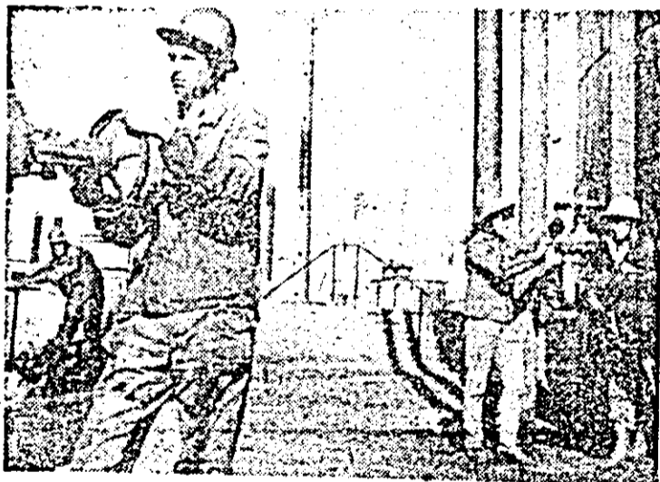
Aspect de muncă la Schelele de producție din Pecica.

Pașină realizată de IOAN ALECU