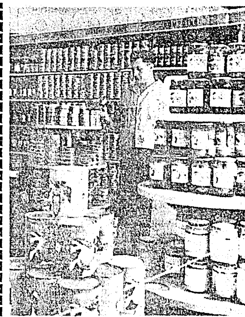
Orașul Pincota. Aspect din magazinul alimentar cu auto-servire.