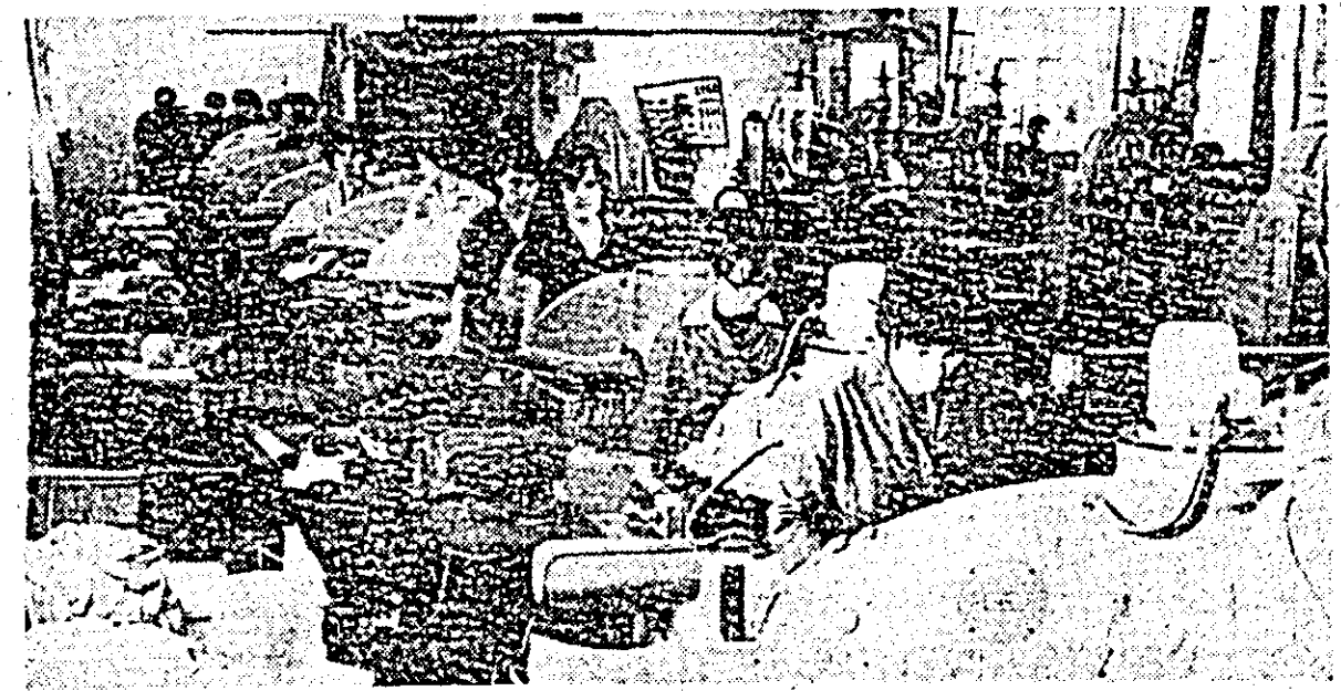
Libertatea - Secția ștanjare (crol), mașini moderne minuite cu pricepere de către tînerele muncitoare realizează importante economii de materie primă.