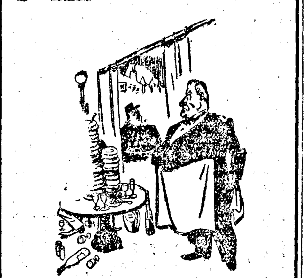
Csak egy repülő-alarm menthetne meg...