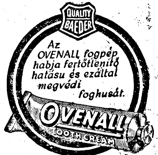
A HABZÓ FOGPÉP

Rio de Janeiro. (Rador.) Jólétesült körökben kijelentették, hogy a brazil kormány meg-