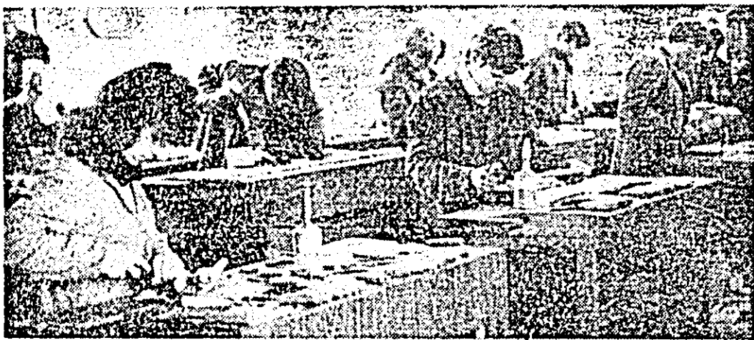
Oră de practică productivă în atelierul de sculptură a Liceului Industrial nr. 5 Arad.

A fi om al muncii astăzi, a fi cetățean demn, presupune însușirea și respectarea unor legi și a unor reglementări impuse obiectiv de societate, norme care se învață și se pretind încă de pe băncile școlii. Pentru ca ele să devină convingeri liber conștientate pe care să se poată clădi disciplina vieții, relația școală-familie apare ca primordială. Din această perspectivă și fără a face „morală” nimănui au izvorât rîndurile de față. Iar dacă ele dau de gândit într-un fel sau altul fiecărei mame, sau fiecărui tată care le citește, cu atât mai bine.