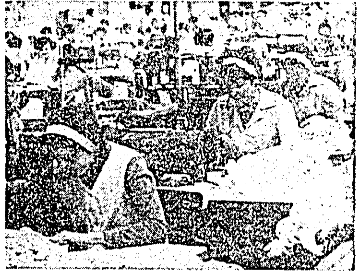
Aspect de muncă în secția confecțiilor a întreprinderii „Tricolor roșu” Arad.