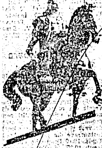
Vaslui, Statuia lui Ștefan cel Mare.

Deși a cerut sprijin, deși acest sprijin i s-a promis, în fata primejdiei Ștefan a rămas singur. Cu cei aproape 40.000 de osteni, fără nici un sprijin din afară, domnul Moldovei și-a așezat tabăra pe valea Bethceului, pentru a aștepta să fie prins la Dunăre între trupele turcești ce treceau fluviul și pasărea lui Laiotă Basarab. Pentru ducerea războiului de apărare, Ștefan s-a pregătit intens, întărind cetățile de apărare a Moldovei și pustindu toată țara pe unde aveau să treacă trupele invadatoare, împiedicînd astfel aprovizionarea armatei turcești, care a început să sufere de foamete și de sete. La toate acestea, s-a adăugat faptul că expediția turcească s-a desfășurat în luna iulie pe timpul unor mari călduri. Cronicarul turc Sa'adeddin scria că din cauza secetei „vesmintele ostasilor s-au acoperit de coib și cenușe, iar nasul și nările lor s-au umplut de praf și scrum”. Totodată, uriașea armată turcească era atacată prin surprindere, de grupuri mici de ostași români, care-i provocau însemnate pierderi. În timp ce detașamentele speciale turcești trimise după hrană și apă erau nimicite de români. Concomitent cu înaintarea ar-