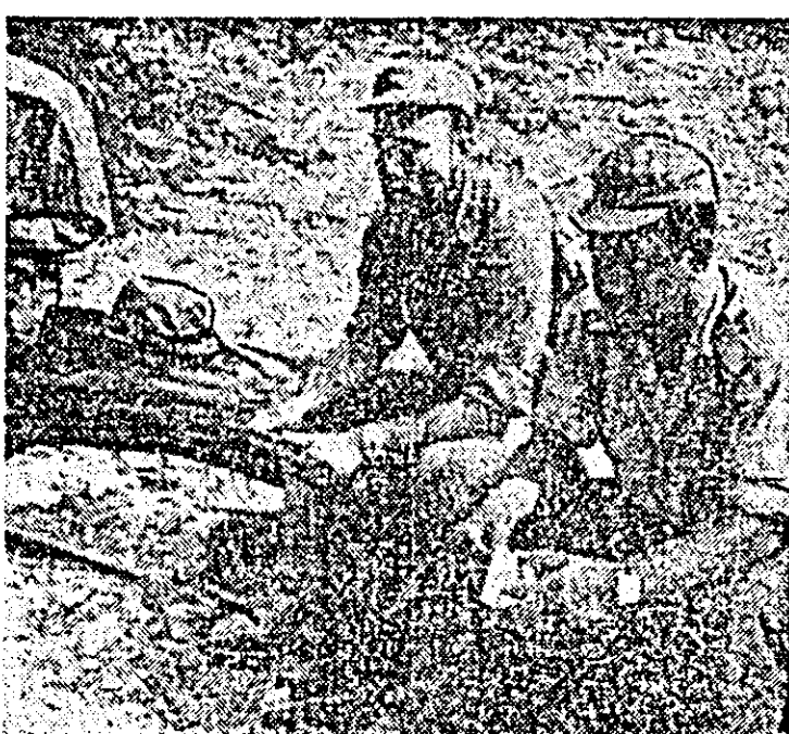
ÎN FOTOGRAFIE: Luptători din vîndurile mișcării de eliberare națională din Guineea „portugheză”, discutînd un plan de acțiune.

KHARTUM. — Organele securității de stat din Sudan au arestat, potrivit agenției