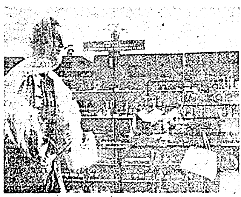
Magazinul „Turist” din orașul nostru oferă un bogat sortiment de produse de artizanat. ÎN IMAGINE: un aspect din interiorul magazinului.