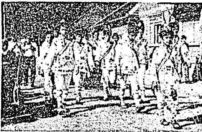
Aspect de la parada portului popular.