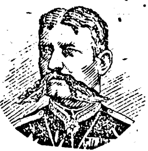
Muzica de Ed. Hubsch.