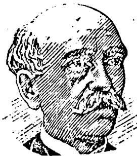
Poezie de V. Alecsandri Maestoso (măref)