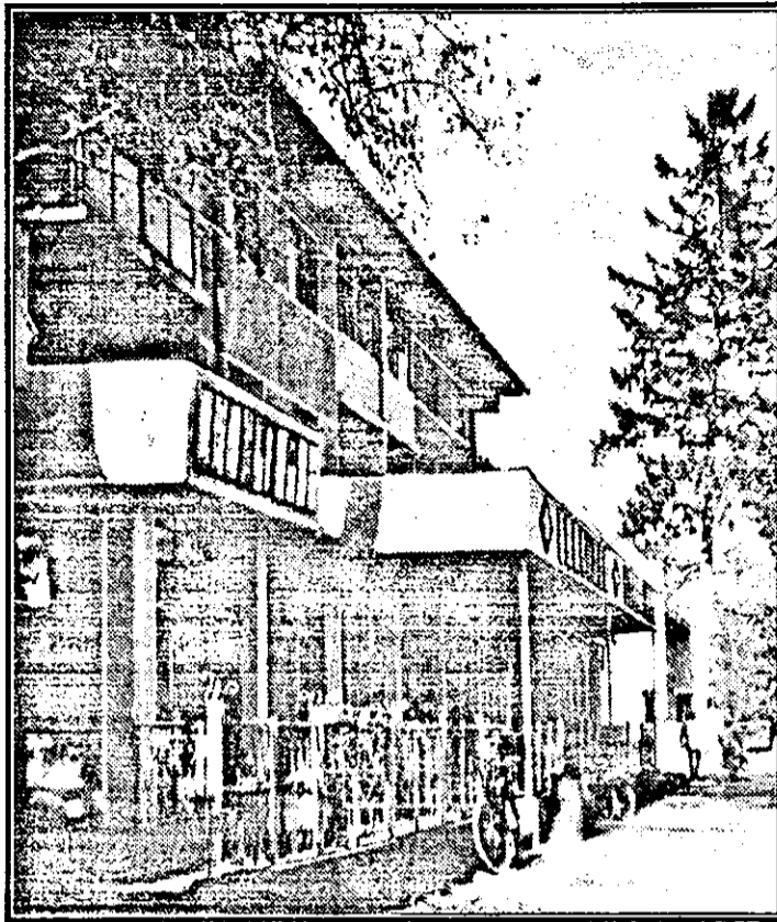
Complexul comercial al cooperăției din Beliu ar merita o soartă mult mai bună.