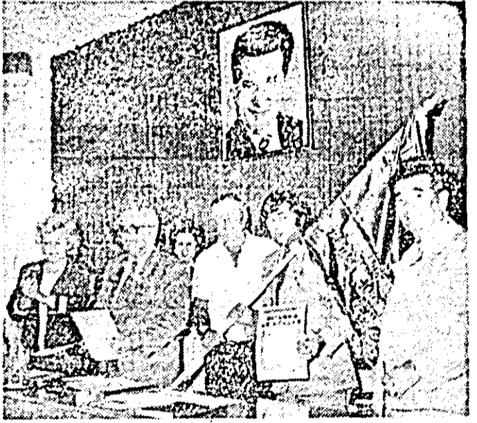
Momente festive la C.A.P. „Lumea nouă” Curtici și C.A.P. „Ogorul” Pecica.