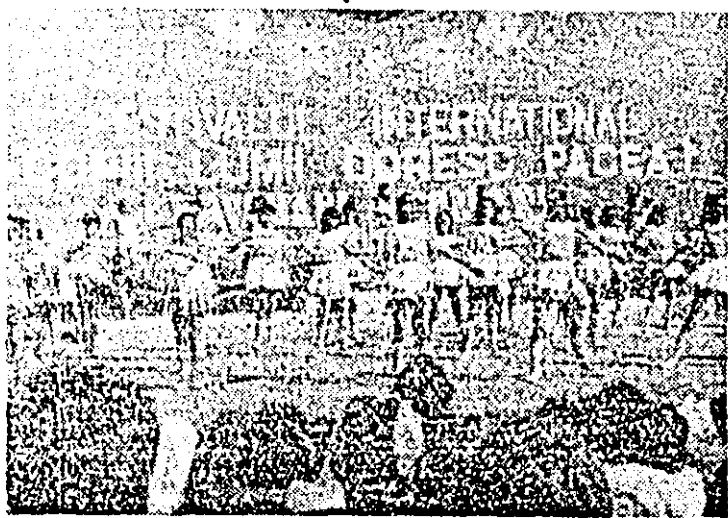
Zile de vacanță pionierească pe litoral.

Pentru iubitorii de excursii pe litoral se organizează în intervalul 29 august—12 septembrie o excursie la Mamaia asigurându-se transportul cu trenul, cazare și masă la prețul de 1445 lei. Informații suplimentare la Filiala de turism intern din Bulevardul Republicii nr. 72, telefon 37279.