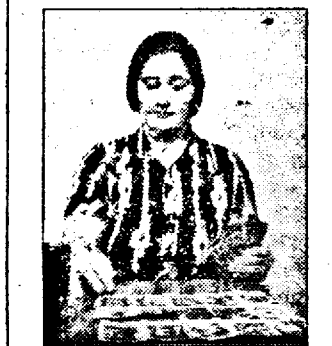
RADA că MI-A LECUIT BĂRBATUL DE BĂUTURĂ. Telefon 057/289429; 092.888.849. (9729)

S.C. BENDEA S.R.L., cu sediul în Arad, B-dul Revoluției nr. 26-38, solicită autorizație de mediu pentru activitatea de comerț cu amănuntul și cu ridicata, pentru următoarele adrese: B-dul Revoluției nr. 26-38; str. Liviu Rebreanu nr. 68; str. Eftimie Murgu FN. Eventualele contestații se pot depune la Agenția de Protecție a Mediului Arad, str. Dragalina nr. 16. (9893)