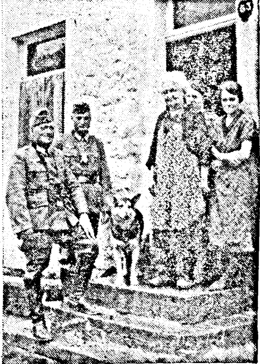
Un grup de oameni germani, după 22 de ani și regăsesc cuartirul pe care l-au avut în războiul trecut.