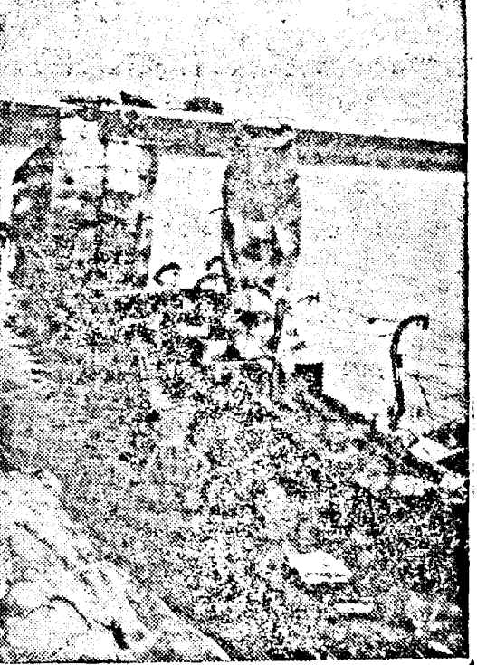
Vase britanice bombardate în porturi de către aviația germană.