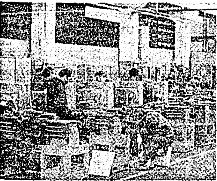
Aspect de muncă în secția montaj a întreprinderii de mașini-unelte Arad.