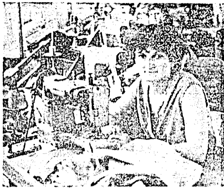
Întreprinderea de confecții Petrita Podobaș este una dintre muncitorile fruntașe din secția I.

Acționați cu înaltă răspundere pentru organizarea lucrului pe cele trei schimburi astfel încît între orele 17—22 să se realizeze minimum de consum. De asemenea, luați măsuri ferme pentru asigurarea unui consum echilibrat pe toate zilele săptămîinii, inclusiv duminică!