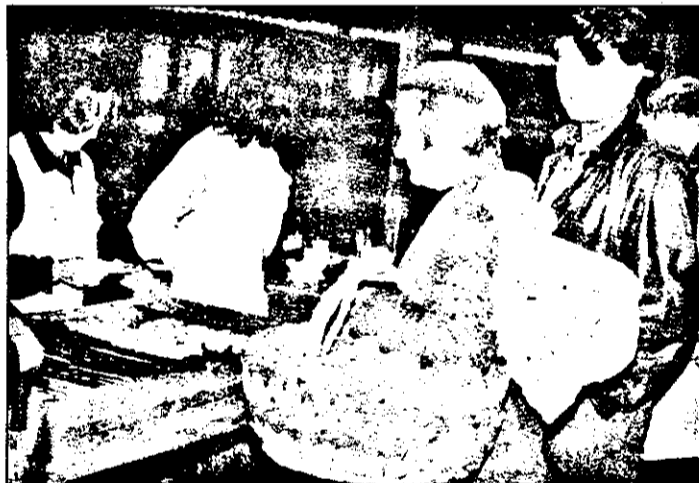
„Cu banii luați pe kilu” de fasole, abia mai poți cumpăra vreo 3 mici. Și încă nici n-am ajuns în economia de piață. Să vedeți ce-o fi când vom ajunge...”