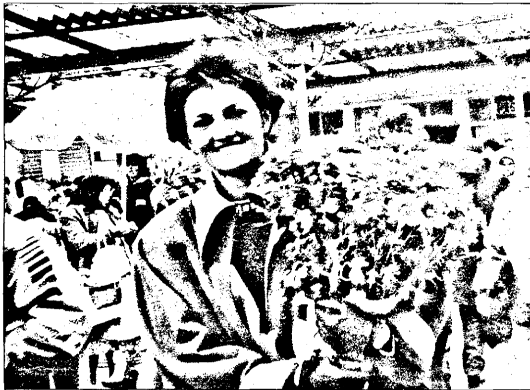
Să mai și zâmbim...mai ales când ne-am făcut o bucurie, cu un buchet de flori.