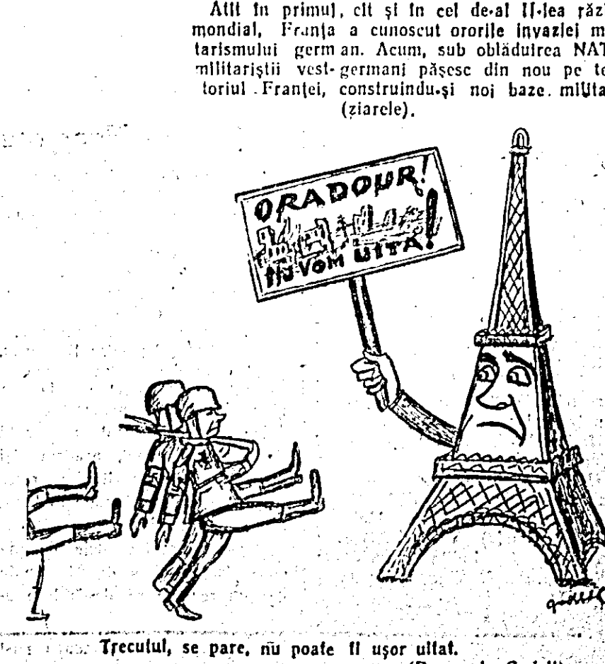
Trecutul, se pare, nu poate fi ușor uitat. (Deșen de Bonelli)

După cum au recunoscut autoritățile locale, guvernul Franței și-a revizuit hotărîrea în această privință, deoarece populația departamentului Charente, pe al cărui teritoriu este situat satul Oradour, distrus în întregime de hitlerişti, a pornit o campanie vehementă de protest împotriva venerii teritorului țărilor la dispoziția trupelor vest-germane.