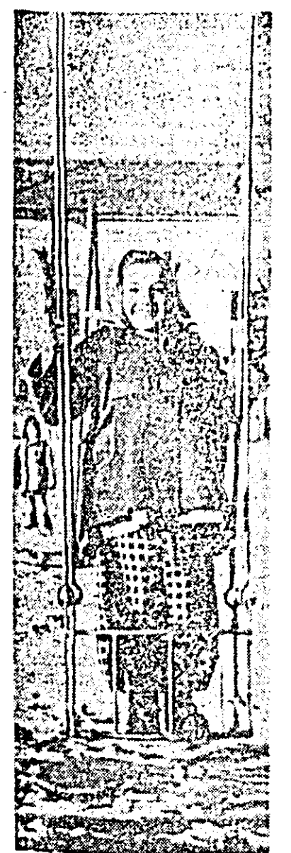
Sîntem în parcul copiilor de pe Malul Mureșului? Nu. Și la Curcili sînt jocuri distractive pentru copii.

casă în casă, stînd de vorbă cu gospodarii, tinerii au reușit în scurt timp să adune mii de kilograme de fier vechi, pe care-l vor trimite oțelărilor patriei. După amiază tinerii s-au îndat la cîmînu cultural unde tovarășul I. Cernăuțeanu le-a făcut o expunere despre comuna noastră ieri și azi. După aceea tinerii s-au închinat la horă. Ziua s-a încheiat cu o în-doită satisfacție: bucuria de a contribui la dezvoltarea economiei noastre naționale și de a petrece timpul liber în mod plăcut, instructiv. I. LAMOȘ, corespondent