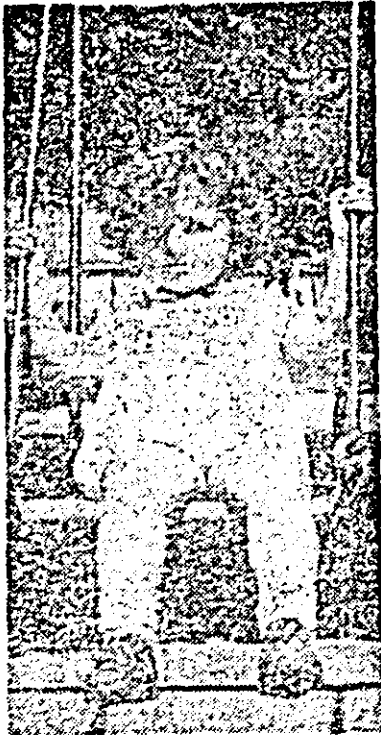
În parcul copiilor.

I-am întrebalt dacă știu că în cîrînd va fi ziua lor, a copiilor. Da, știu că într-o zi anume pe an „oamenii din toată lumea li sărbătorește pe ei, dar că anul acesta, întregul an este al copiilor”. Și mai știu că — în cîrînd se vor muta într-o clădire mult mai frumoasă, iar pentru copiii de la I.A.S. se construiește o grădiniță nouă. Așa e la noi, toți anii sînt dedicați fericii copiilor, viitorului lor luminos... LIVIA POPA