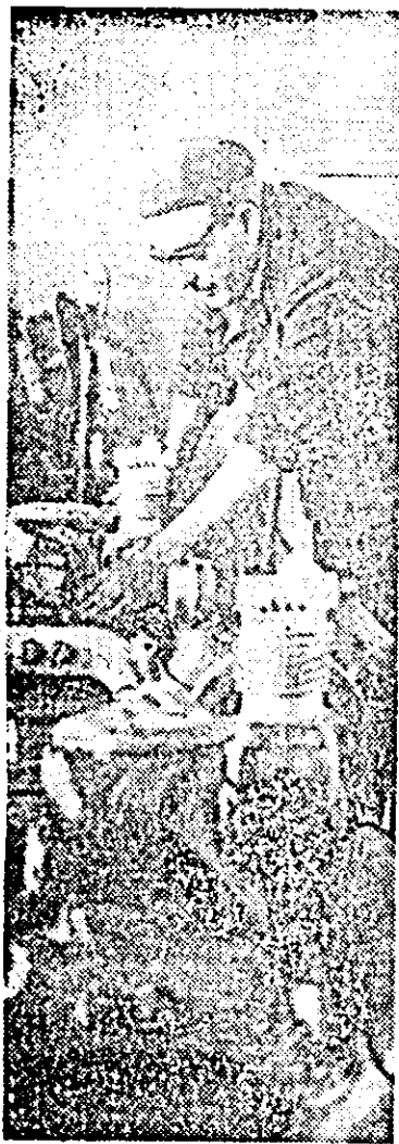
Mecanicul Iosif Vogel de la ICOA execută lucrări de calitate superioară la repararea motoarelor pentru autobuze.