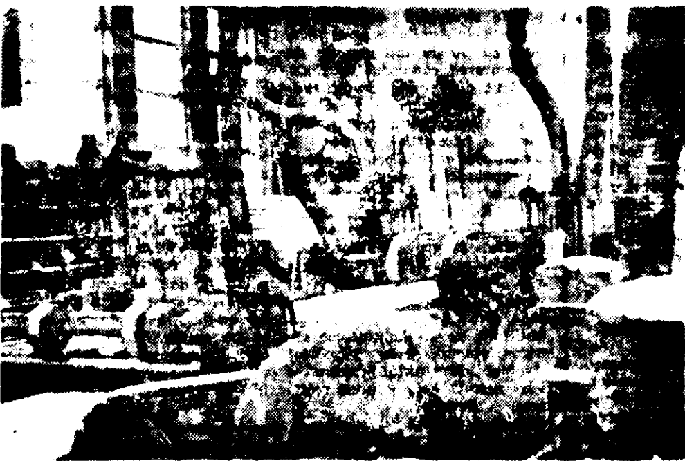
Fabrica pentru produse finite din lemn. Este una din importante unități industriale ale orașului nostru. În fotografie: Agregatul de producere automată, multiplică a profiilor din lemn unul din utilajele moderne cu care este dotată fabrica.

În aceste zile fabrica de cosarnice „Victoria” a fost pusă în funcțiune o nouă mașină de rulat filete pentru bolțurile distanțiere ale cosarnicelor. Este vorba nu de un utilaj primit din fonduri de investiții ci de o creație proprie, executată în fabrică prin autoutilare de către colectivul secției scularie. Noua mașină rezolvă o veche „doleanță” a producției în secția uzinei. Aceasta deservea vechiul procedeu ora mai greu și dădea o productivitate scăzută. Acum, datorită faptului că se folosează ambele capete ale bolțurilor simultan și nu separat ca înainte, productivitatea obținută e mai mare cu 30 la sută.