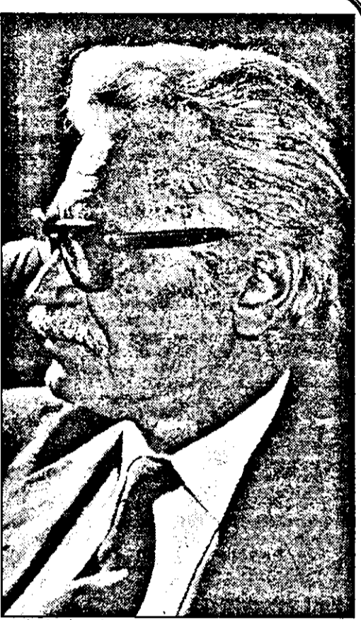
mai târziu, dacă se pot numi compromisuri, regizând marile festivități județene. Jos, sus, ghemuit. Ceauscu pe C.R. Stima noastră și mândria. - Vi se dădeau indicații? - Da, din partea secretarilor cu propagandă și a comitetului de cultură.