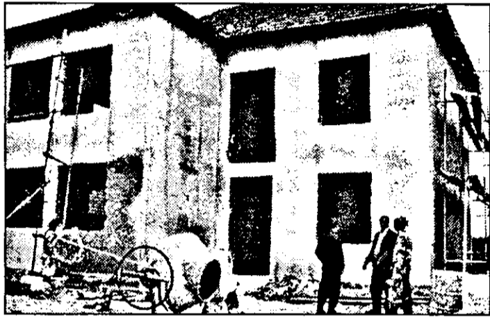
Consiliul local și Primăria din Apateu se vor muta cât de curând în casă nouă. D-l primar e încrezător că de-acum încolo activitatea celor două instituții va fi mai fructuoasă...

meargă cu măsurarea de la A la Z într-o comună și apoi să se treacă la următoarea. S-a început acțiunea peste tot și nu s-a mai terminat nici-unde!”