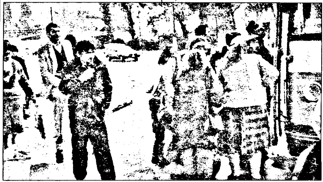
Călători prea mulți, bagaje prea multe, autobuzul prea mic și deci o aglomerație mult prea mare. Sau, altfel spus, un transport auto în comun prea puțin modern, prea puțin civilizată.

Ne-am temut că nu vom intra în Consiliul Europei din motive nesemnificative: ba că minoritatea maghiară n-ar avea nu știu ce drepturi, ba că homosexualii ar fi persecutați. Nu de astfel de lucruri trebuia noi să ne temem, ci de faptul că, aflată de atâtea ori în România, unui (ne)bun român i-ar fi venit neinspirata idee de a urca-o pe doamna Lalumiere într-o cursă auto județeană. Norocul nostru a fost că nu s-a întâmplat așa, și că între drepturile omului nu figurează expres și dreptul la un transport în comun civilizată. N-am mai fi intrat noi „în Europa” nici de acum în 10 ani, după cum veți vedea în cele ce urmează. (M.C.)