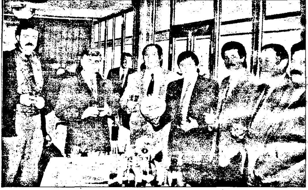
Oameni de afaceri adunați în jurul „balonului rotund” ce ne-a fost oferit de clubul UTA (pe minge, autografele jucătorilor). Merci, „Bătrână Doamnă”!