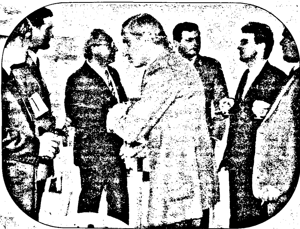
Armata și jandarmeria sunt cu noi - chiar și la un pahar de vorbă

Din partea biroului de presă a filialei Arad a Uniunii „Vatra Românească”