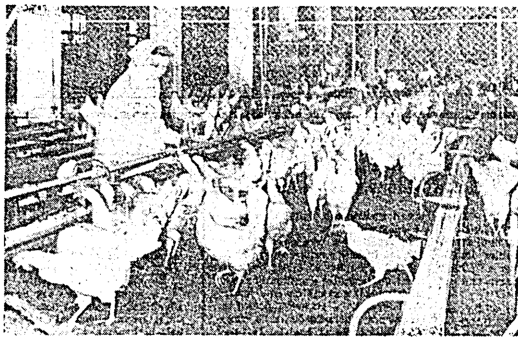
La întreprinderea avicolă de stat Arad, ferma 6 Vladimirescu, furnizarea găinilor este complet mecanizată, rolul omului fiind doar de supraveghere a bulei funcționării a utilajelor.