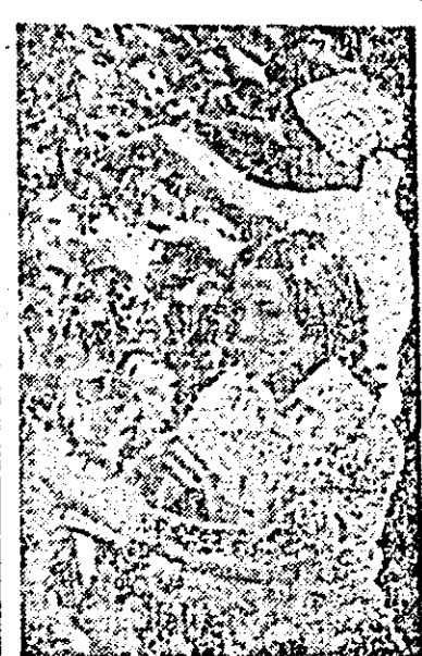
Elevi ai Liceului economic și de drept administrativ din Arad în practica de vară la I.A.S. Sagu.