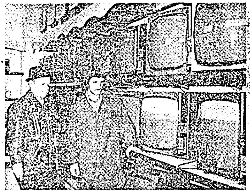
Ați aflat? Incepând cu 1 ianuarie a.c., prețul televizorului a fost redus cu 20 la sută. Plata se face în 24 de rate lunare, iar avansul este egal cu prima rată. După cum vedeți și în fotografie, meștrii de specialitate vă așteaptă cu un sortiment bogat de televizoare.

COMITETUL MUNICIPAL BUCUREȘTI AL PARTIDULUI COMUNIST ROMÂN