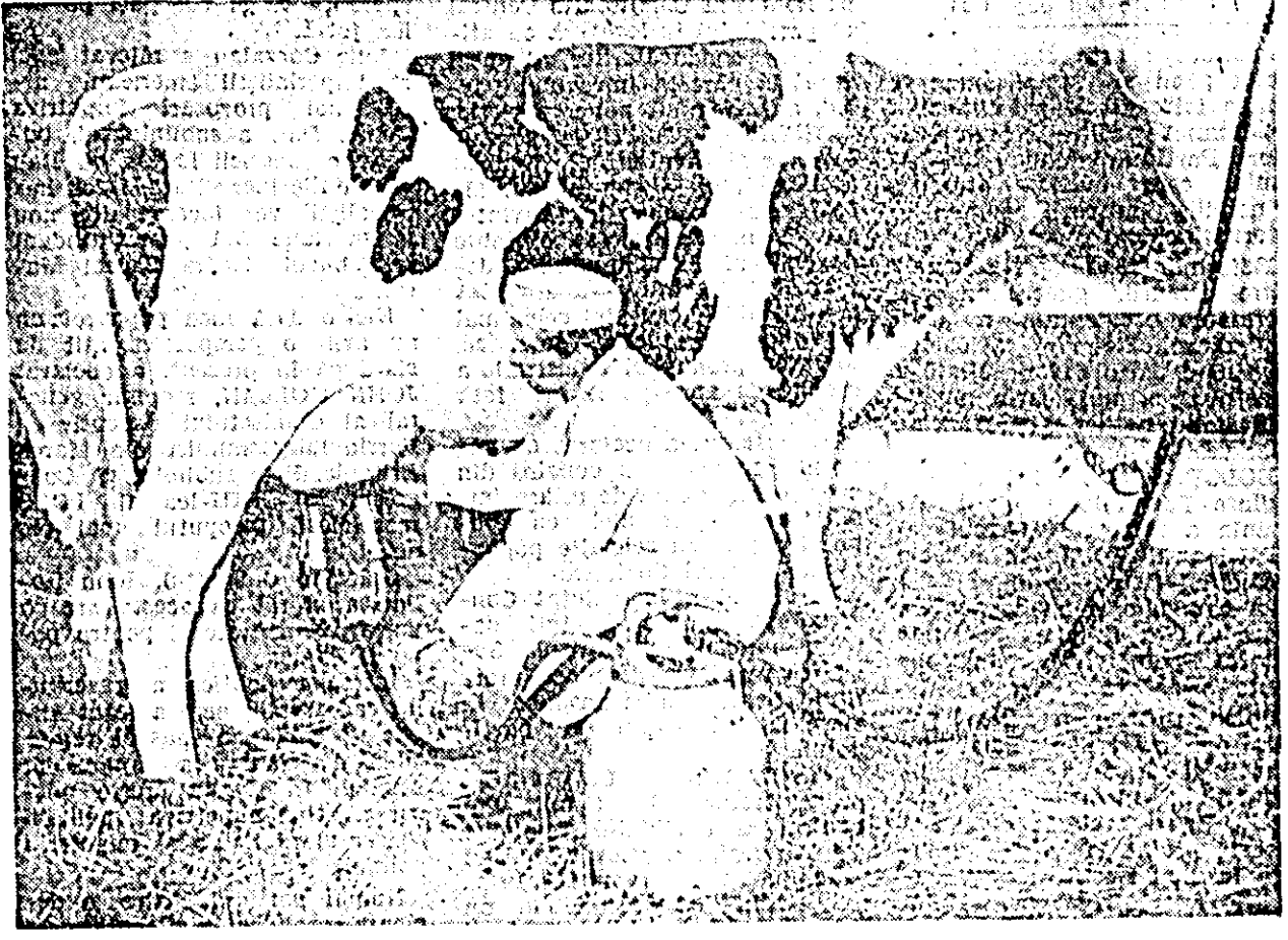
IN CLIȘEU: tov. Mihal Giscă, unul dintre fruntașii gospodării, executînd mulsul mecanic al vacii „Aria” care deși este abia în faza de pregătire a lactației, datorită bunelor îngrijiri și furajării, ca de pe acum zilnic 34 litri de lapte.

„Să luptăm pentru a obține 4.500 l lapte pe cap de vacă furajată”. „Printr-un procentaj de grăsimă de 4 la sută, la fiecare 100 litri dăm statulul în plus 14 litri de lapte”. Acestea sînt două lozinci de la ferma de vaci. Dar oare au reușit crescătorii de animale de la GAS Vladimirescu să le îndeplinească? Să lăsam faptele să vorbească.