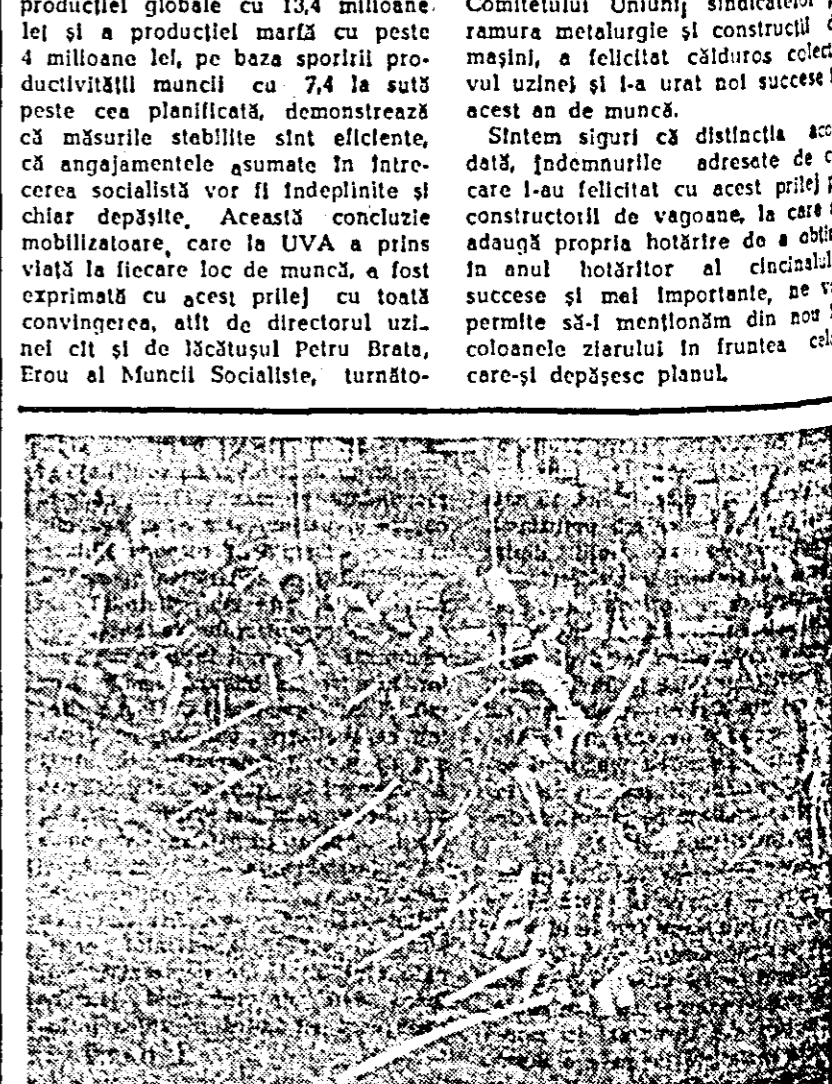
Tinerii arădeni participă cu entuziasm la înfrumusețarea orașului.

Sîntem siguri că distincția acordată, îndemnul adresat de cei care l-au felicitat cu acest prilej și constructorii de vagoane, la care se adaugă propria hotărîre de a obține în anul hotărîtor al cincinalului succese și mai importante, ne vor permite să-l menționăm din nou în coloanele ziarului în fruntea celor care-și depășesc planul.