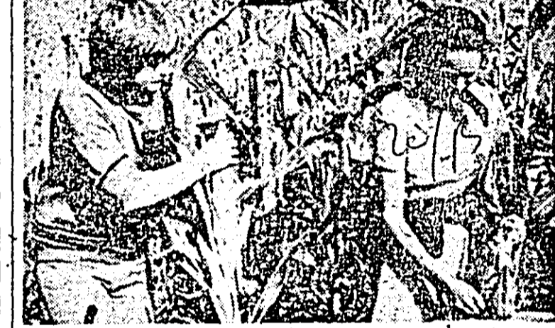
Elevii școlii generale din Sînpetru German recoltează porumbul de pe terenul micro-cooperativelor.

În cursul lunii octombrie, organizația județeană a pionierilor se ocupă cu numeroși noi membri. Printre cele mai emolvente înalte onoruri de pionier a căvatelelor s-au ridicat cu numărul 100 de la Monumentul eroilor de la Păuliș (Școala generală Radna), sala de Istorie a Muzeului județean (Școala generală nr. 2 Arad) și muzeul lui Avram Iancu și gorunul lui Horia de la Tebea (Școala generală Buleni).