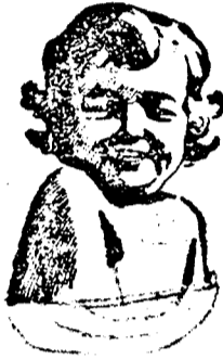
JELKEPE A TISZTASÁGNAK

A Cadum az arcazint gyöngéden felfrisíti és meztisztítja a bőrt anélkül, hogy ingerlő hatást váltana ki. Az anyák olyan tisztának és finomnak tartják.