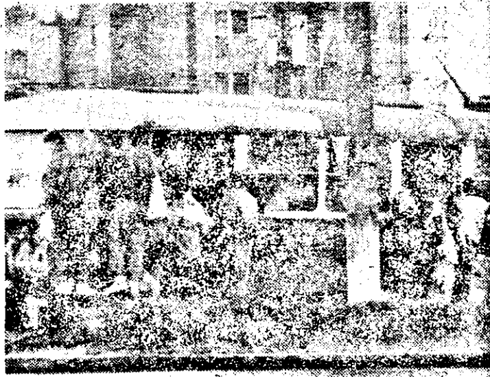
Pe tramvai — prețuri noi, conforti vechi.