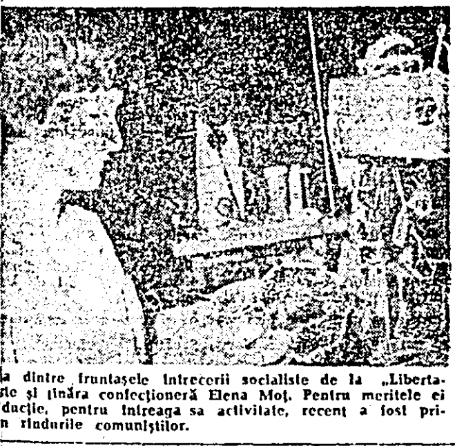
...dintre fruntașele întrecerii socialiste de la „Libertate” și înăra confecționeră Elena Mot. Pentru meritele ei deosebite, pentru întrecerea sa activitate, recent a fost primită în rândurile comunistilor.

mulți dintre ei au văzut-o acum pentru prima oară — să aibă cîntecul de a fi primiți de președintele Nicolae Ceaușescu, fiul poporului român, care simbolizează însăși patria din care se trag. Tovarășul Nicolae Ceaușescu și tovarășa Elena Ceaușescu, celalți tovarăși din conducerea de partid și de stat au răsplătit cu aplauze măiestria interpretativă a tinerilor mesageri ai artei românești din Canada. A luat cuvîntul tovarășul Nicolae Ceaușescu. Căldura și prietenia cu care li s-a adresat șeful statului român au stîrnit o vio emoție în rîndul oaspeților care au subliniat cu aplauze cuvîntarea președintelui Nicolae Ceaușescu. În încheierea întîlnirii, tovarășul Nicolae Ceaușescu și tovarășa Elena Ceaușescu s-au fotografiat în mijlocul grupului de tineri și membri ai clubului „Mihai Eminescu” din Regina.