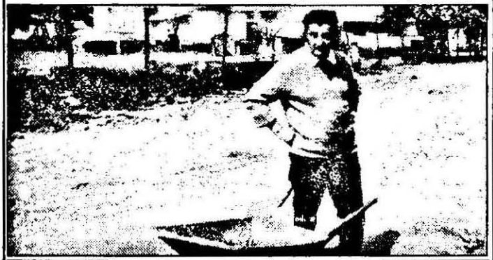
„Omul cu roaba” s-a jucat de-a v-ași ascunselea cu echipa de control. Până la urmă a pierdut.