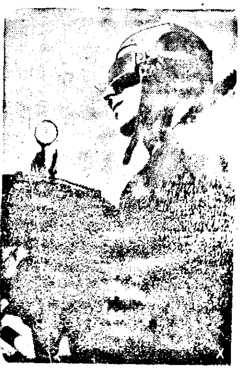
Schüsse am schweren Maschinenge- wehr. (Frank)

Beyer-Modell R 21083 (für 98 und 96 cm Oberweite). Die Brust- und Seitenta- schen des ganz schmalen, streng sportli- chen Kleides sind als Jallentaschen mit aufknöpfbarer Klappe gearbeitet. Erforder- lich: etwa 2 m Stoff, von 130 cm Breite. Beyer-Modell R 35135 (für 88 und 96 cm Oberweite) mit schrag zugeschnittenem Rock kann auch mit weichem Aufschlagtra- gen gearbeitet werden. Beide Möglichkei- ten sieht der Schnitt vor. Erforderlich: et- wa 2,65 m Stoff, 90 cm breit. Beyer-Modell R 35136 (für 88 und 96 cm Oberweite). Dieses jugendliche Kleid zeigt die Umrisse, zum weiten gekräu- selten Rock die durch einen breiten Gürtel betonte schmale Taille. Erforderlich: etwa 2 m Stoff, 130 cm breit. Beyer-Modell R 35164 (für 84 und 96 cm Oberweite). Der Seitenschnitt des ju- gendlichen sportlichen Kleides ist für die Ta- schen schrag verarbeitet. Das Kleid hat Knopfverschluss im Rücken. Erforderlich: etwa 1,85 m Stoff von 130 cm Breite. Alle Kleider sind im Schnitt mit zweiter- lei Nermeln gegeben. Zeichn. Ae. Hüger.