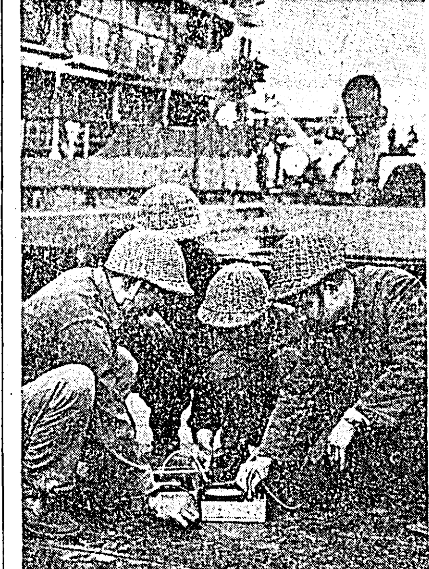
Specialiștii chinezi de la Uzina de echipaj electric din Șanhai au construit recent un aparat de măsurare cu ultrasunete, foarte des întrebunțat în șantierul naval. ÎN CLISEU: mîncătorii unui șantier naval din Șanhai măsoară „coroziunea” unei plăci de oțel, cu ajutorul noului aparat.

Dezbaterile din cadrul conferinței de la Londra se anunță deci aprinse. Observatorii nu consideră probabilă acceptarea de către Marea Britanie a unei date apropiate pentru proclamarea independenței. Or, un asemenea refuz este de natură să adîncească dificultățile existente în insulă. N. R.