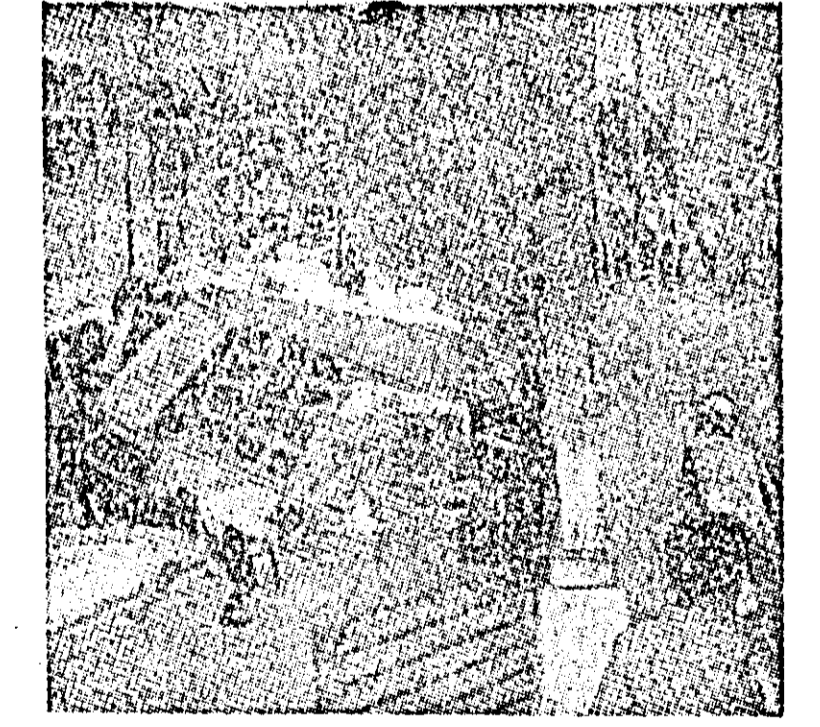
În cursul unei recente acțiuni anti-americane, manifestații din Hwa au distrus și incendiat centrul de Informații American.

Unele contacte între Balaguer și reprezentanții Partidului revoluționar dominican dovedesc că de fapt el nu dorește să împartă portofoliile ministeriale ale viitorului guvern cu opoziția, conținînd mai ales pe sprijinul care îl are din partea armatei. Cei mai mulți comentarii de presă apreciază că aleggerile generale care au avut loc la 1 Iunie în Republica Dominicană nu au putut rezolva problemele esențiale ale crizei dominicane și că retragerea trupelor interamericane, a căror intervenție a provocat această criză, continuă să stea în centrul revendicărilor poporului dominican.