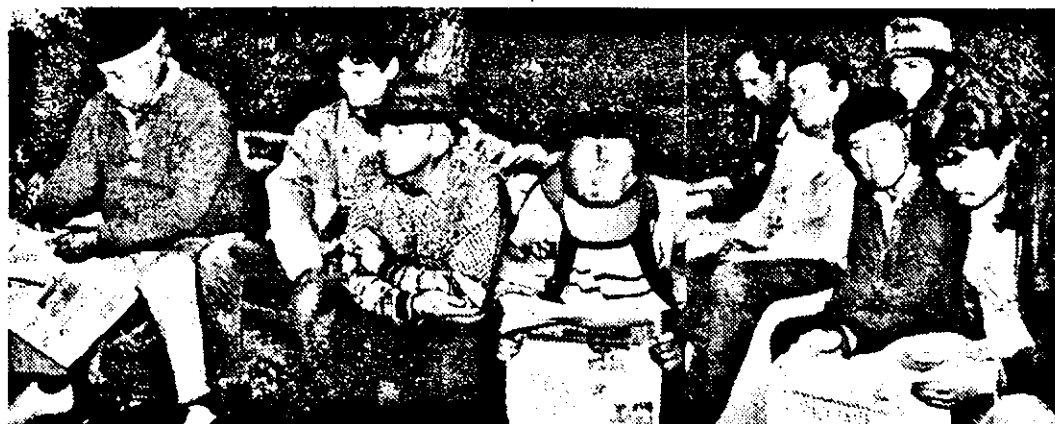
Salariații S. C. Vitivinicola Barațca sunt în grevă generală. În așteptarea revendicărilor ei citează ziarul „Adevărul”.

(Continuare în pagina a 6-a) →