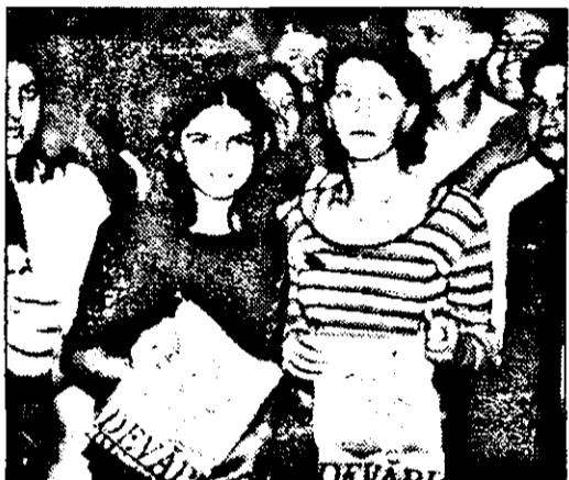
Tricourile „Adevărul”, adjudecate de două tinere simplice

Și dacă tot a pomic la drum, atunci dl. Brănișcan s-a gândit s-o facă cât mai bine. Astfel că inaugurarea discotecii a început cu sfințirea localului de către protopopul orașului Lipova. Pentru că - după