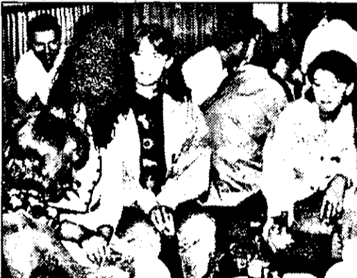
După câteva runde de dans epuizant, combatanții se răcoresc

Și pentru că așa se cuvine într-o seară specială, nu putea lipsi un premiu mai... inedit. De la microfonul prezentatorilor a fost invitat să-și ridice premiul - fără să se spună în ce constă - pentru cel (cea) care a consumat cele mai multe beri până la acea oră. După câteva clipe de... ezitare „în bloc”, spre pupitrul a pășit cam neîncrezător un tânăr.