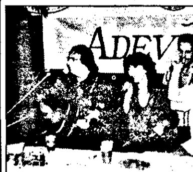
„Andri Popa” cântată de toți cei prezenți pe platoul din discoteca Mega-Sfinx