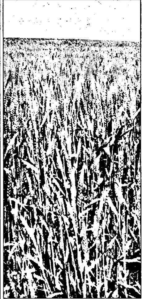
La Peregul Mare, cei care au primit pământ, o să aibă și recoltă bună în acest an, cei care nu...