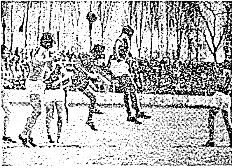
O continuă luptă pentru balon, pentru victorie. Fază din meciul Rapid—Strungul.