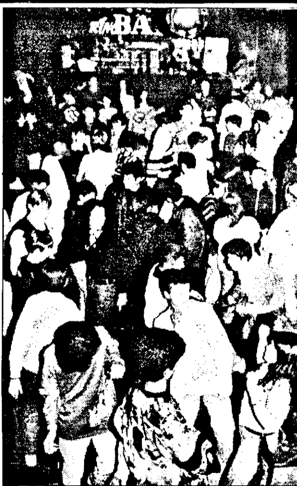
Discotecile cele mai căutate rămân Ring, Sfînx și Ateneu. Acolo unde taxa de intrare este cea mai scăzută.

Dacă dansul și băuturile sunt mai „pipărate”, totuși sunt localuri unde pot fi întâlniți clienți între 14 și 30 de ani aproape 24 de ore din 24. De pildă la bar club Biliard „Casablanca” de pe Calea A.