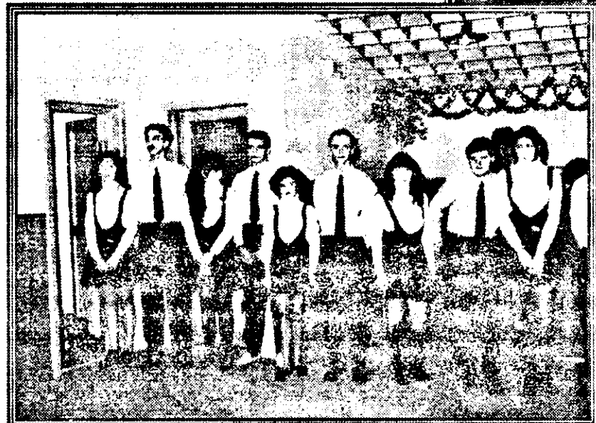
Tinerete, frumusețe, profesionalism - sau nota zece pentru personalul de la Bingo Gooool