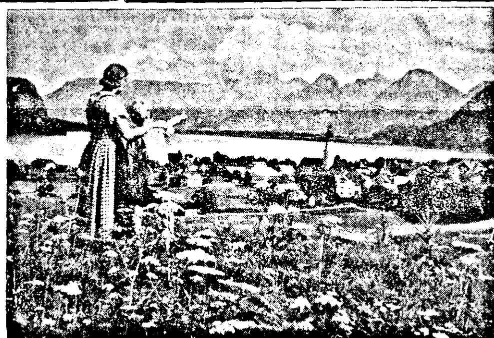
Frühling in den Bergen.

rauf hinwies, daß Deutschland und Italien bestrebt seien, Frankreich zu isolieren und im Wege von Spanien Frankreich zur Errichtung einer dritten Verteidigungsfront zu zwingen. Nicht genug damit, sondern sie gefährden auch die Verbindung Frankreichs mit Ostafrika, wohl an dem heikelsten Punkte Frankreichs. „Wenn das so weiter geht“, setzte Guernon fort, „wird in einigen Monaten die Herrschaft Englands im Mittelmeere nur mehr eine Erinnerung sein.“