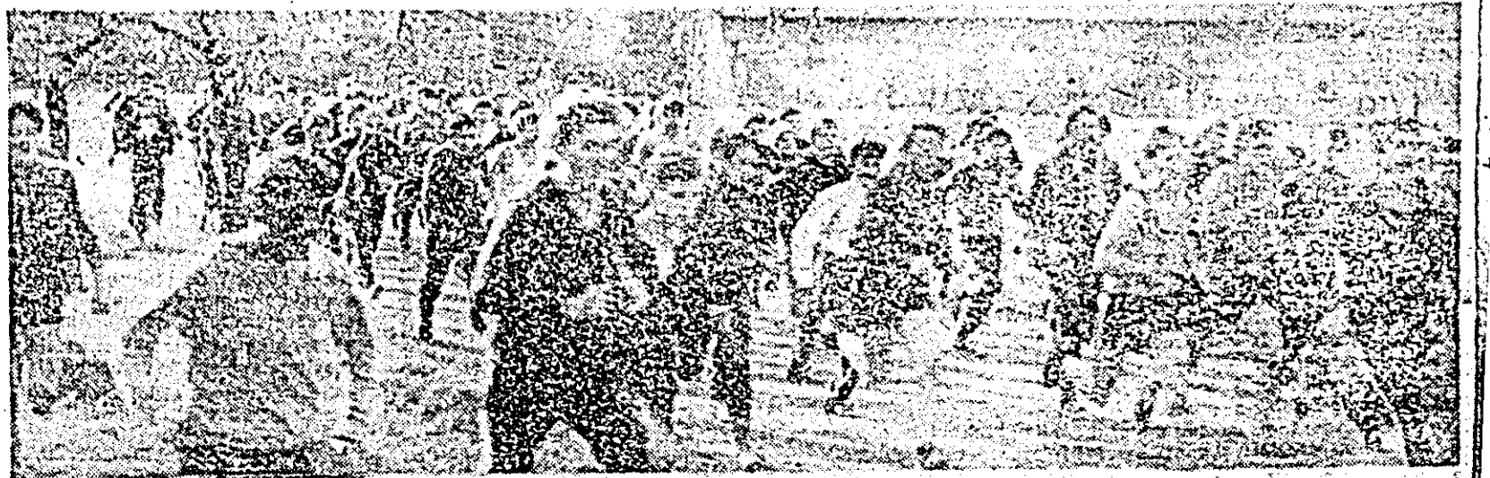
Imagine de la Crosul tineretului desfășurat duminică în incinta strandului.

● BANATUL TIMIȘOARA — STRUNGUL ARAD 0-0.