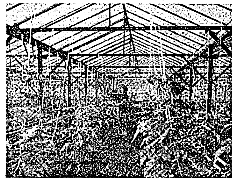
Deși sîntem în plină iarnă sub cupola de sticlă a întreprinderii de sere e mereu primăvară.

Unu de mult, semnalam faptul că reparația utilajului agricol în I.A.S. trebuie intensificată, unele lucrări fiind rămase în urmă. În primul timp s-au luat măsuri de recuperare a restanțelor, mai ales la tractoare, astfel că în prezent stadiul reparațiilor și revizorilor a atins 60 la sută din planul I.A.S. Aradul Nou, 55 la sută la I.A.S. Lipova ș.a. Totuși în unele unități, cum sunt cele din raionul mai ales, Utvinis, Șagu, și altele, ș.a. tractoarele au fost parțial reparate în prea mică măsură, fapt care privește în mare măsură, în ce privește semănătorile, acestea au fost reparate la I.A.S. Lipova în proporție de 60 la sută, dar la I.A.S. Cermei, Nădlac, Semlac, până zilele trecute, lucrările nici n-au început. Mai trebuie spus că la mașinile de aplicare îngrășămintelor rezultate bune înregistrat I.A.S. Aradul Nou, și altele, ș.a. reparațiile la aceste mașini.