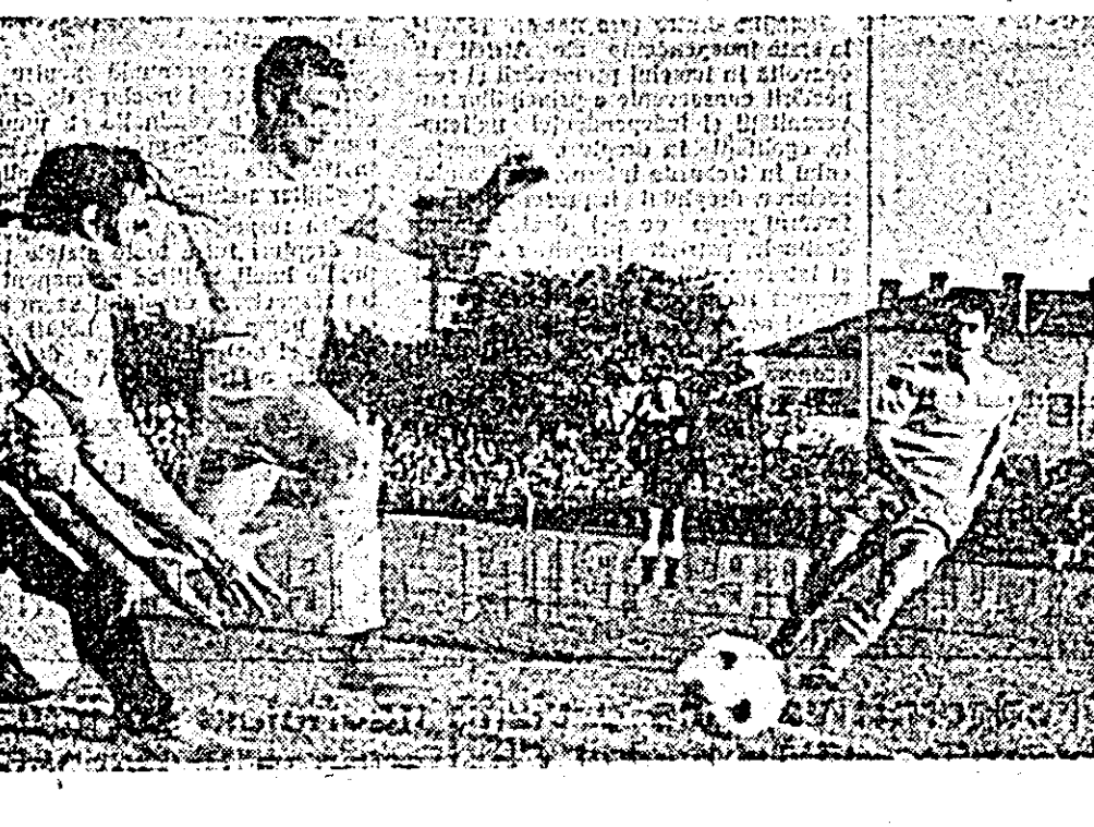
Secvență din meciul UTA — Dinamo București desfășurat simbătă la Arad și încheiat cu victoria neesperată a oaspeților.

ASA ARATĂ O VARIANTĂ CU 13 REZULTATE EXACTE LA CONCURSUL PRONOSPORT Nr. 21, ETAPA DIN 23 MAI 1971 I. Bologna — Torino 1 II. Cagliari — Verona 1 III. Catania — Napoli x IV. Inter — Lazio x V. Juventus — Fiorentina x VI. Lanerossi — Sampdoria x VII. Roma — Milan x VIII. Varese — Foggia 1 IX. Ceahlău — Melrom x X. S.N. Offenja — Știința Bacău 1 XI. Gaz metan — Crisul x XII. Gloria — Politeh. Timis. x XIII. CSM Reșița — CSM Sibiu x Fond de premii: 294.166 lei. Plata premiilor pentru acest concurs se va face astfel: În Capitală începînd de vineri 26 mai pînă la 8 iulie 1971 inclusiv; În țară începînd aproximativ de marți 1 iunie pînă la 8 iulie 1971 inclusiv.