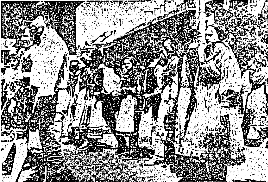
Aspect de la închiderea festivalului „Primăvara arădeană”: parada portului popular.

Bu manifestările de duminică, prestigioasă și tradițională manifestare „Primăvara arădeană” a luat sfârșit.