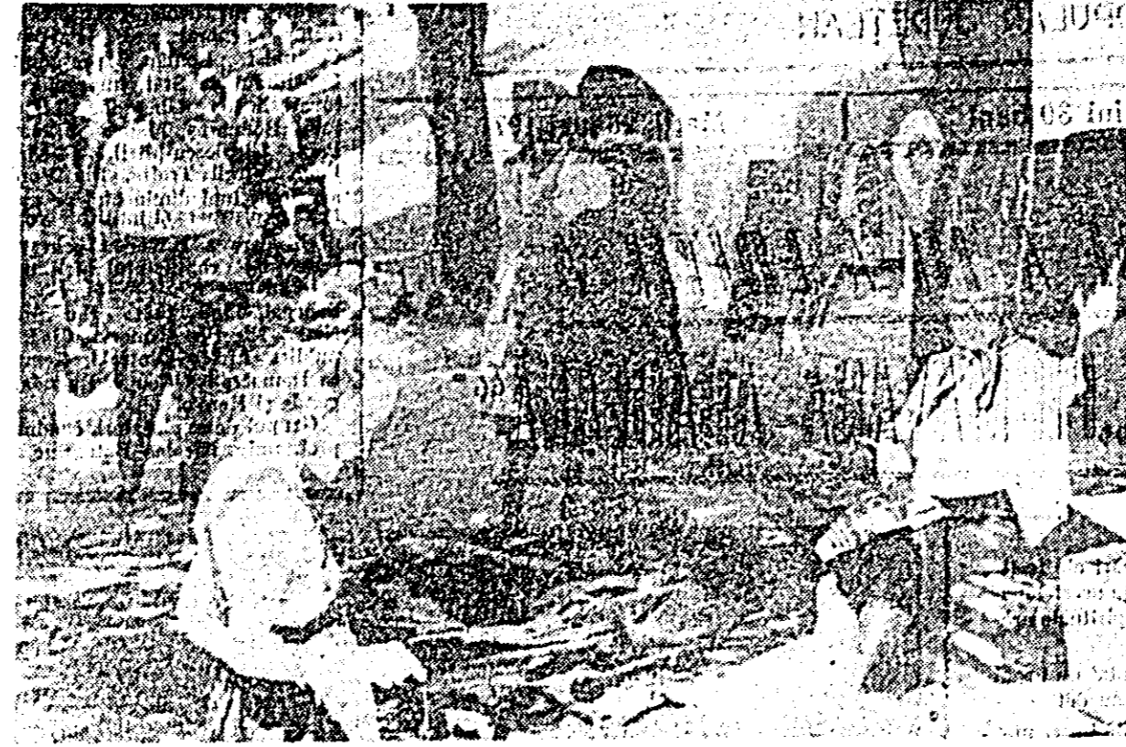
Aspect de la Tirgul de artă populară ținut duminică în Parcul copiilor.

Tirgul de artă populară, deschis în Parcul copiilor, a cuprins o