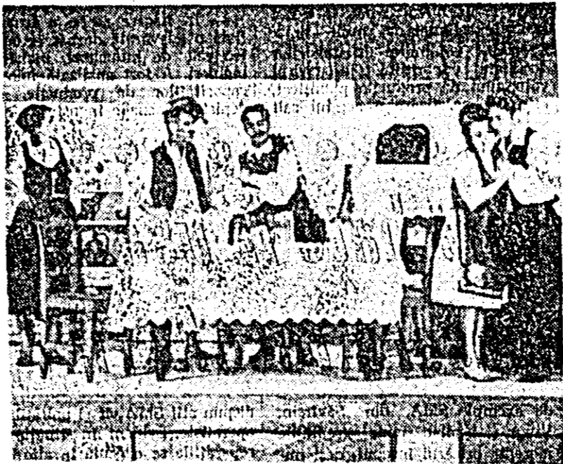
Imagine din spectacolul cu piesa „Fata de birou” de Ioan Slavici prezentat de artiștii amatori de la câmpul cultural din Pecea cu ocazia constituirii Asociației culturale „Ioan Slavici” la Șiria.