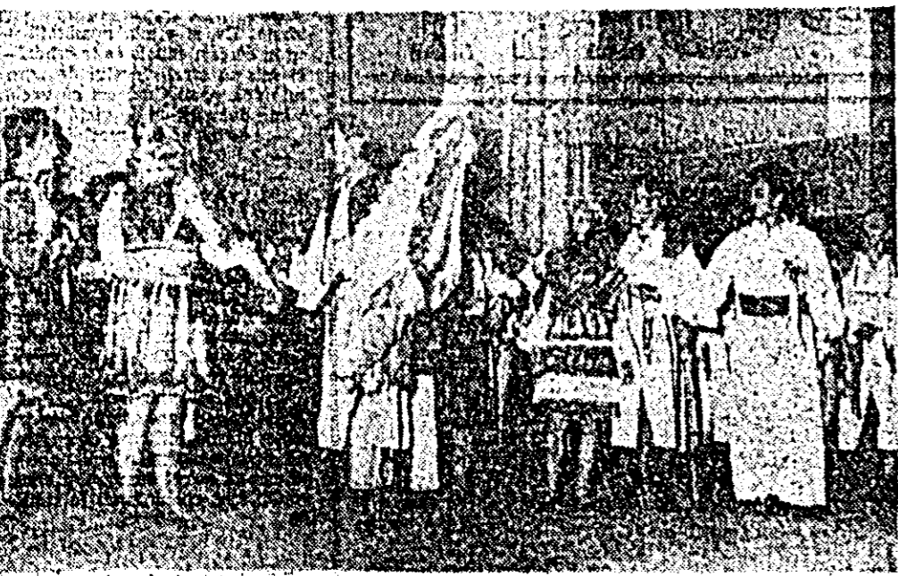
Secvență din spectacolul „Nunta de pe Mureș” susținut duminică pe scena Palatului cultural.

Avem deplina convingere că prin utilizarea și mai eficientă a timpului de lucru afectat reparațiilor și mai buna colaborare a secțiilor cu unitățile cooperatiste pe care le deservesc vom reuși să raportăm terminarea acțiunii în termenul prevăzut, iar atunci cînd lanurile de cereale vor intra în pirgă să trecem cu toate forțele la recoltarea și depozitarea lor fără nici o pierdere.