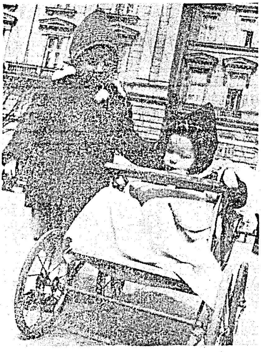
Odată cu poposirea primelor zile insorite ale primăverii, pe străzile orașului nostru înflorește tot mai multe flori, dragălașenie și zîmbet.

Eliminînd neajunsurile semnalate, constructorii de vagoane vor putea recupera rămînerea în urmă a planului de export și realizarea exemplară și ritmică a celorlalte sarcini din actualul trimestru.