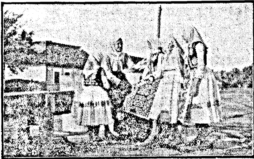
Fete bănățene la fântână.