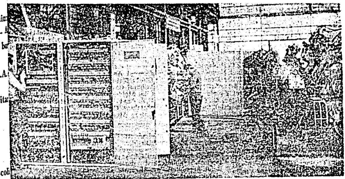
Între realizările cele mai recente ale colectivului întreprinderii de strunguri pe calea ridicării nivelului tehnico-calitativ al producției se numără și asamblarea în fabricație a strungurilor grele. O secvență de muncă din secția unde se realizează asemenea strunguri.