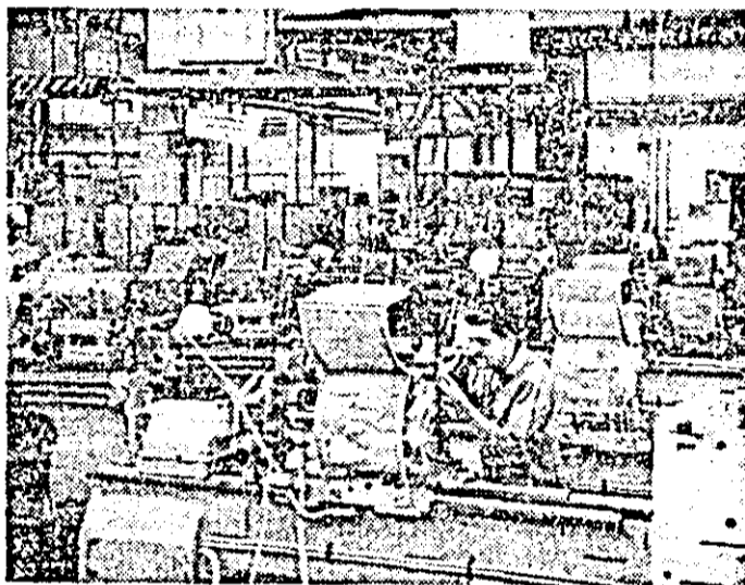
I.M.U.A. la secția montaj, ritmul muncii se deslășoară la cote superioare.

din mai multe țări, încă 82 000 de păpuși. Succesul amintit este un rezultat al bunei organizări a muncii pe fluxurile tehnologice, al eforturilor depuse de toți lucrătorii care muncesc cu deosebită râvnă neadmițând nici cel mai neînsemnat ratat la capitolul calitate.