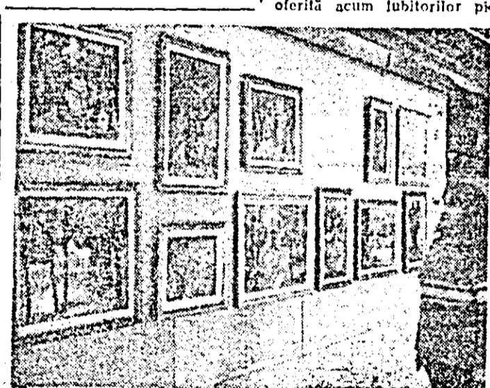
Aspect din expoziția de artă plastică Ștefan Guleș deschisă la sala „Alfa”.

Expoziția foarte unitară oferită acum iubitorilor pic-