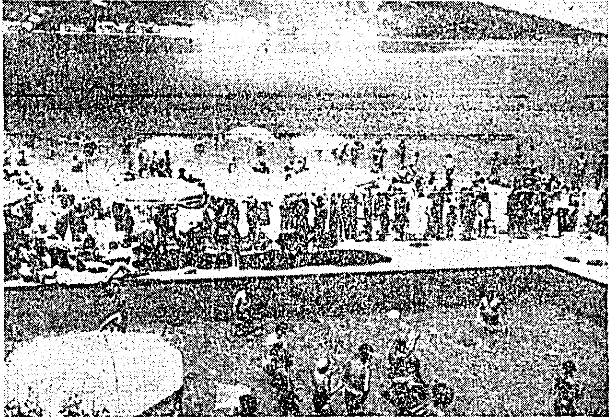
R.S.F. IUGOSLAVIA: Seronul estival este în plin la Pola. — Bazinul de înot sau marea — două alternative pentru cei dormici să se răcorească.

„Pe scurt, scrie revista, perspectiva este aceea a unei perioade de frustrări. Gospodniile vor avea o mulțime de motive să se plîngă de sporierea continuă a prețurilor. Producătorii de oțel, de automobile și de materiale de construcții vor cunoaște o scădere generală a vânzărilor. Problema locurilor de muncă se va înrăutăți pentru tinerii de la orașe. Investitorii vor avea puține motive să se bucure. Pare să fie o perioadă proastă pentru cei de la putere care caută să obțină din nou puterea și o perioadă de profunde griji pentru cei care încearcă să vină la putere, dacă vor cîștiga alegerile”.