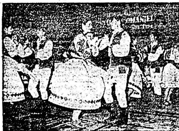
Formația de dansuri populare a întreprinderii de mașini-unelte pe scena Festivalului național „Cîntarea României”.